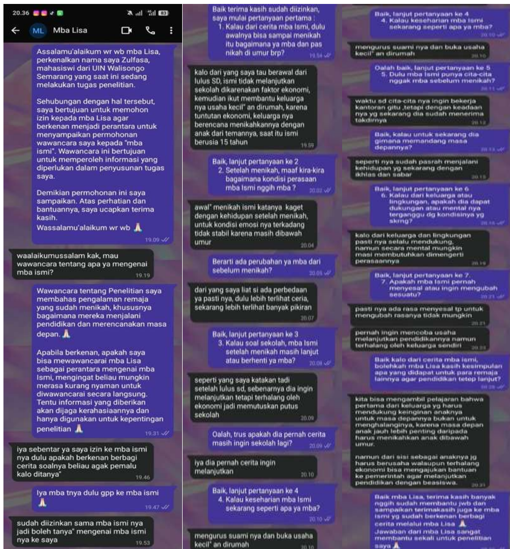
Gambar 2. bukti chat/obrolan dengan perantara narasumber.