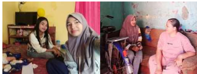
Gambar 1. Wawancara dengan tokoh remaja.

memasukkan literasi kesehatan mental dalam kurikulum untuk mengakomodasi kerentanan siswa yang menghadapi tekanan domestik (Juntak et al., 2023). Semua upaya ini perlu diperkuat melalui kolaborasi lintas sektor guna membentuk “jalur darurat pendidikan” yang memungkinkan reintegrasi cepat ke sekolah. Tanpa intervensi pemulihan psikologis yang menyeluruh, pendekatan pencegahan saja tidak akan mampu memutus siklus kemiskinan dan keputusan eksistensial yang selama ini menyandera potensi remaja secara permanen.