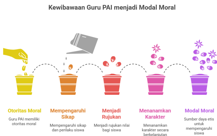
Gambar 1. Konsep Kewibawaan menjadi Moral.

Siswa juga mengekspresikan bahwa nilai karakter lebih mudah diterima karena disampaikan oleh guru yang mereka hormati. Seorang siswa menyampaikan, “Kalau Pak Guru PAI menasihati tentang jujur dan sopan, rasanya beda, jadi malu sendiri kalau melanggar” (Wawancara Siswa, 2025). Rasa “malu” tersebut menandakan terjadinya internalisasi nilai secara afektif.